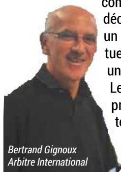
Bertrand Gignoux Arbitre International

Il est souhaitable mais pas toujours obligatoire que les joueurs respectent un tempo régulier et un comportement constant. Toutefois les joueurs devront être particulièrement vigilants dans des situations où des variations seraient susceptibles de profiter à leur camp. Dans le cas contraire, changer involontairement le tempo ou le comportement accompagnant une déclaration ou un jeu ne constitue pas en soi une infraction. Les inférences provenant de telles variations ne peuvent être utili-